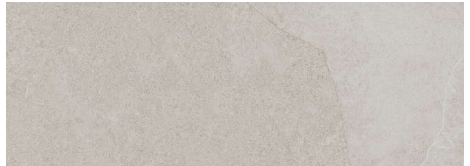
Pavimento porcelánico 50 x 50 S/Rect coord. MIXIT de KERABEN