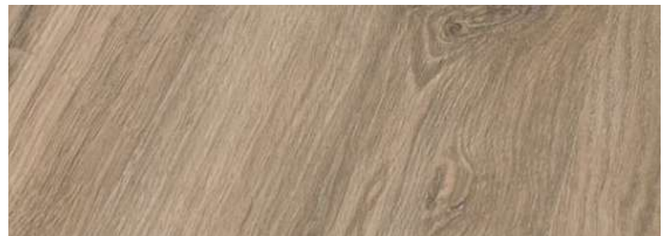
Alicatado blanco RC 25 x 70 S/Rect ATRIUM de KERABEN