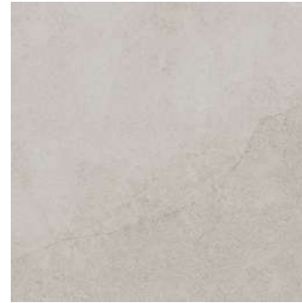
Pavimento porcelánico 50 x 50 S/Rect coordinado MIXIT de KERABEN